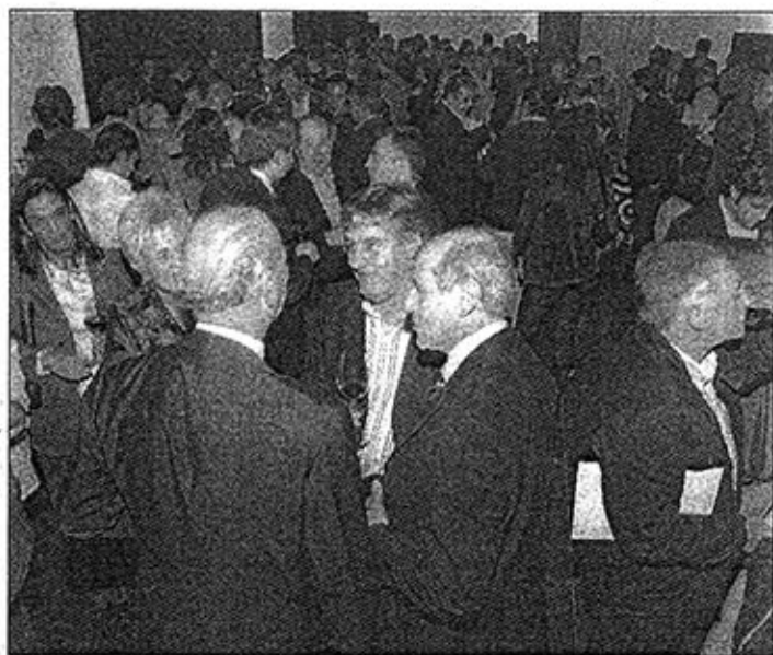
ACTE A MAS MARROCH. Va aplegar cap a mig miler de persones.

El grup Marqués de Vargas el conformen tres empreses: Bodegas Marqués de Vargas (D.O.C. Rioja), Conde de San Cristóbal (D.O.