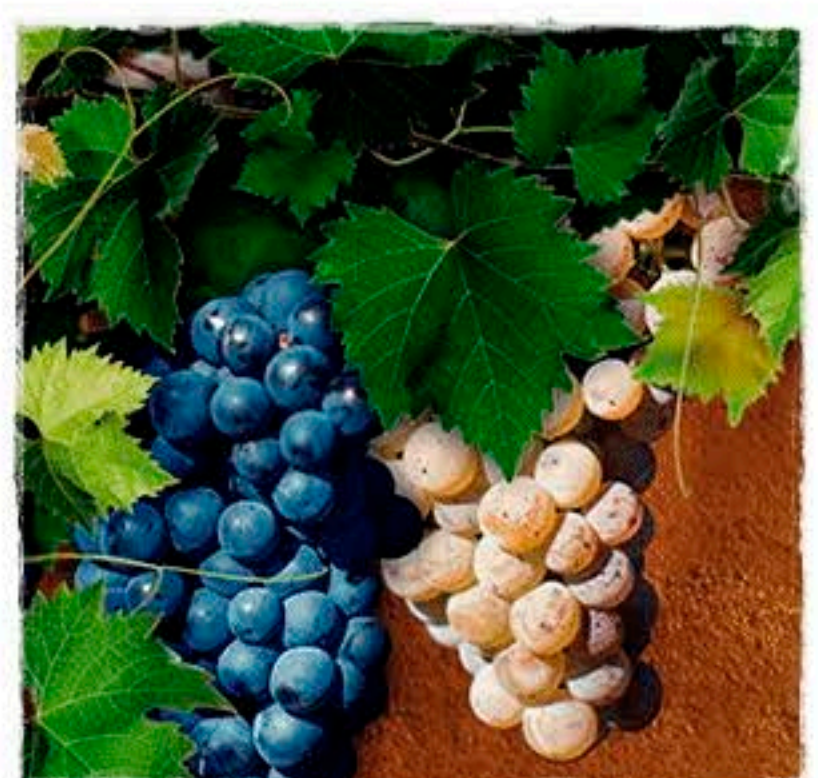
Prioridade 3 Medida 3.2.